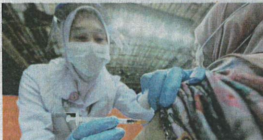
Penerima vaksin AZ semasa tempoh pandemik Covid-19 pada tahun 2020 hingga 2022, tidak perlu rasa panik atau risau.

"Berita baiknya, TTS boleh dirawat menerusi rawatan imunoglobulin secara intravena untuk menghalang penghasilan antibodi PF4, juga ada ubatan yang dapat menghalang pembentukan darah beku dan sumbatan pada salur darah," katanya.