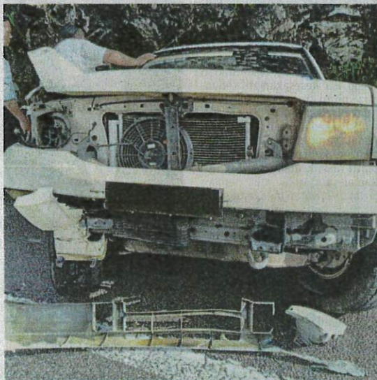
KEADAAN pacuan empat roda Mitsubishi Pajero yang terbabas di Kilometer 263.4, Lebuhraya Utara-Selatan arah selatan, Ipoh, semalam.

IPOH: Dua kakitangan Kementerian Kesihatan Malaysia (KKM) cedera selepas kenderaan pacuan empat roda yang dinaiki mereka terbabas kemalangan di Kilometer 263.4, Lebuhraya Utara-Selatan arah selatan, di sini semalam.