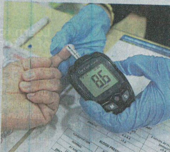
Prudent monitoring: A diabetes patient checking her blood sugar at a pharmacy.

"The current healthcare system is not sustainable. What we need is the political will to do it."