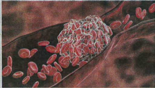
TTS melibatkan pembentukan darah beku yang boleh menyebabkan sumbatan (trombosis) pada salur darah dan juga penurunan platelet (trombotositopenia).

Jelas Eusni Rahayu lagi, punca sebenar TTS selepas vaksinasi masih belum diketahui secara terperinci namun secara dasarnya ia berkait dengan kecelaruan imun setelah individu menerima