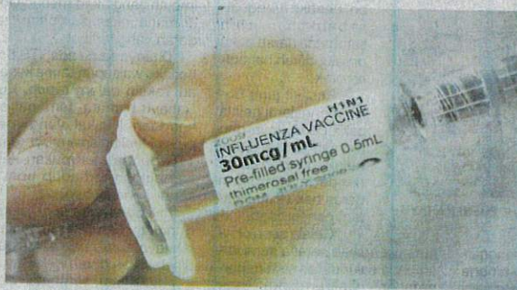
KKM mempertimbangkan untuk melaksanakan pemberian vaksin influenza terhadap warga emas.

"Dos ini perlu diambil setiap tahun kerana virus influenza ini ber-